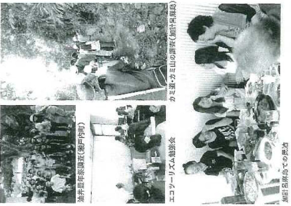
岡山理科大学の奄美島調査の様子。左から：学生が野外調査を行っている様子、学生が実験を行っている様子、学生が観察を行っている様子。