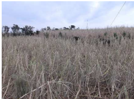
被災状況(サトウキビ)