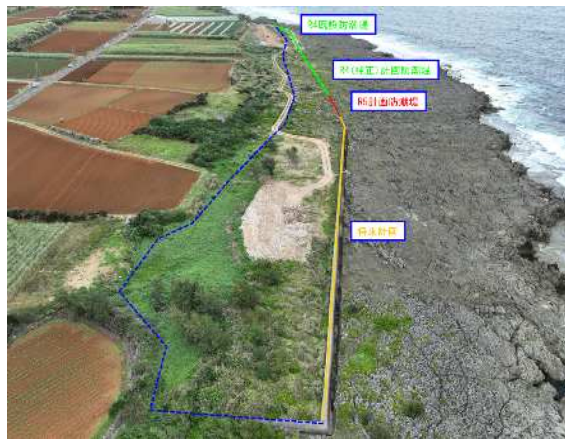
計画地全景 (R5計画 赤実線)