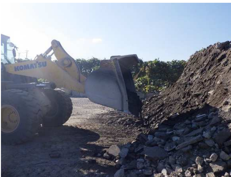
AS10%・コン殻90%混入状況