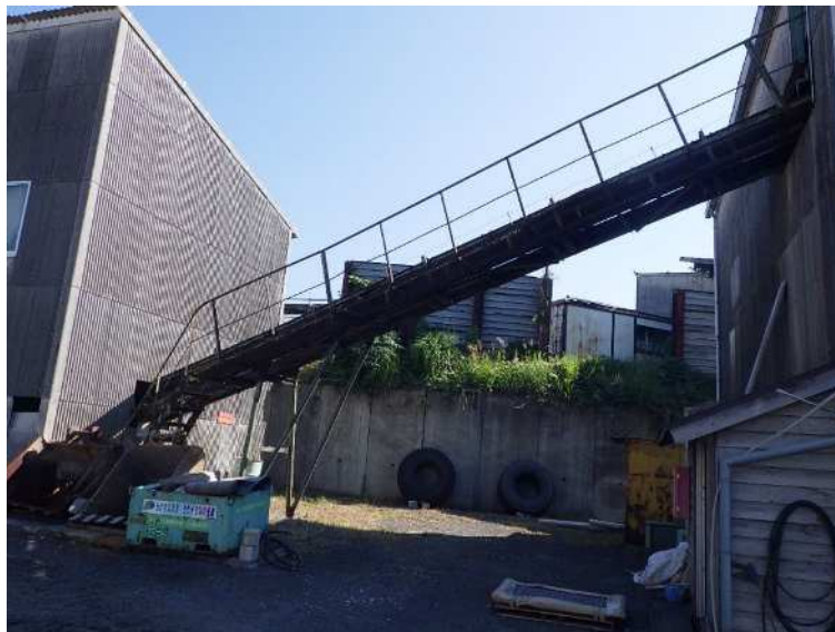
移送式製品ベルコン