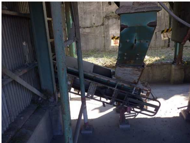
オーバーサイズ戻り