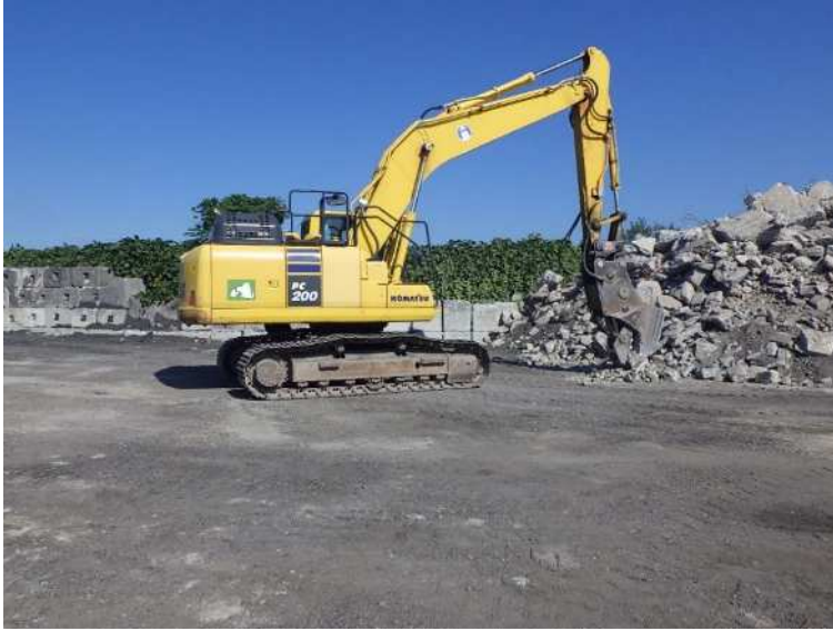
油圧ショベル・小割機により コンクリート塊を1次破碎 (鉄筋・異物除去)