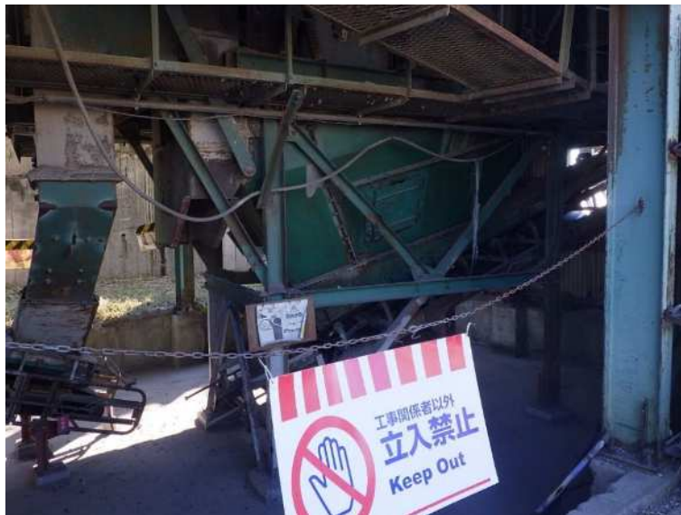
振動篩下ホッパー