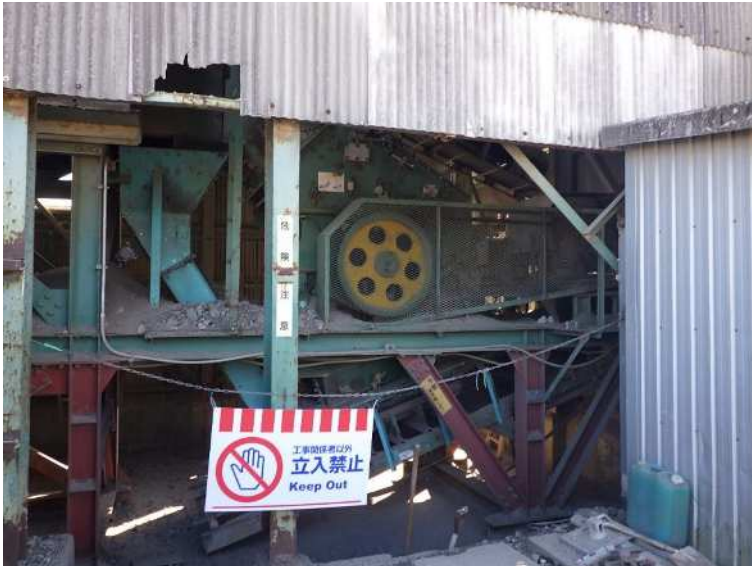
インパクトクラッシャー 2次破碎 処理能力 50t/h