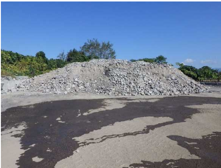
1次破碎後コンクリート塊ストック状況