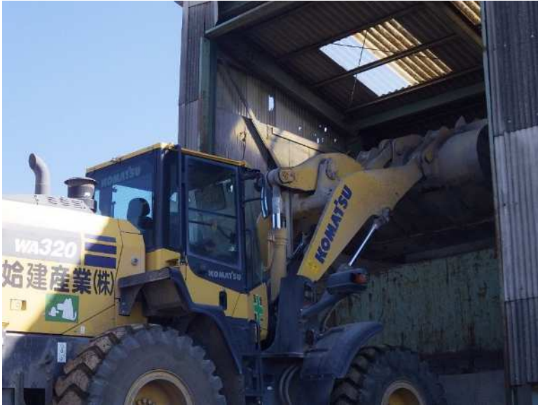
原材料投入ホッパー (Co90%, As10%を混合して投入)