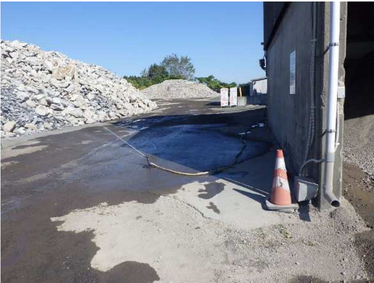
防塵対策 散水状況