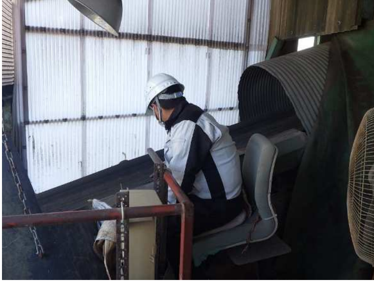
(人手による異物除去)