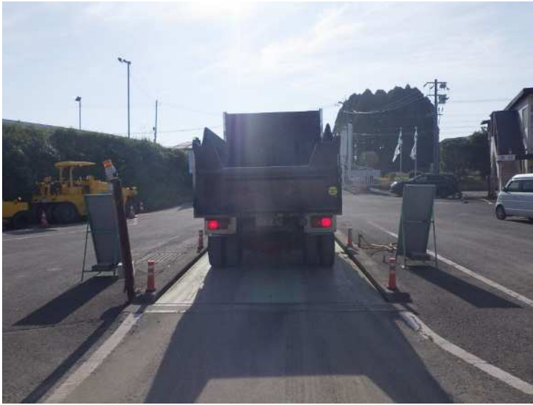
コンクリート塊ストック状況