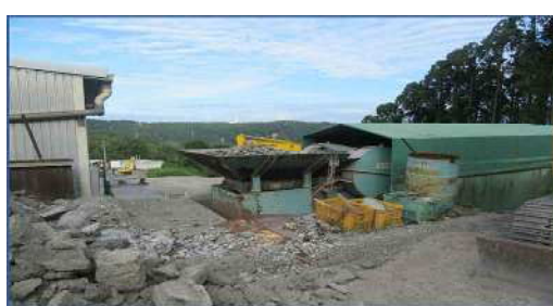
破碎ユニット ・(株)中山鉄工所 HFA4M型 にて破碎処理 ・破碎後、磁選機で異物除去