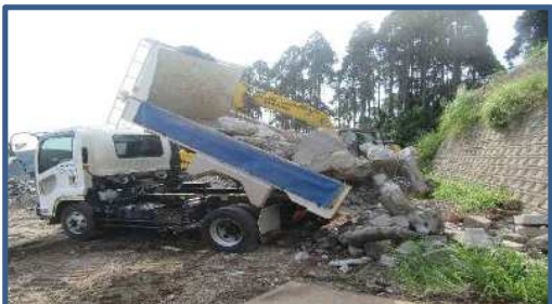
原材料保管場所へ荷下ろし CoとAsは別々に保管