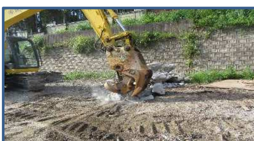
磁選機付小割機 ・大きい廃材の小割 ・磁選機で鉄筋等の異物除去 ・Co殻、As殻は別々に小割