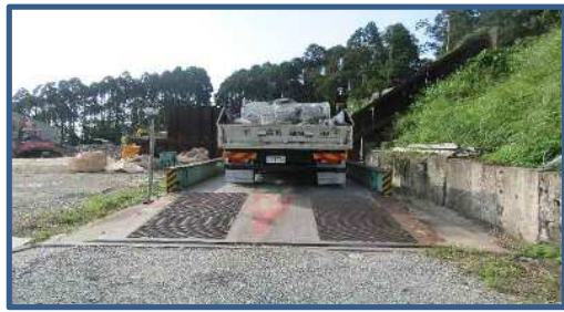
原材料(コンクリート塊、アスファルト塊)の搬入