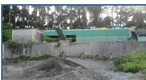
選別機 (スクリーン) ・(株)中山鉄工所 PBS750型 ・30mmスクリーンで選別 ・30mmオーバーは再度、破碎ユニット で破碎