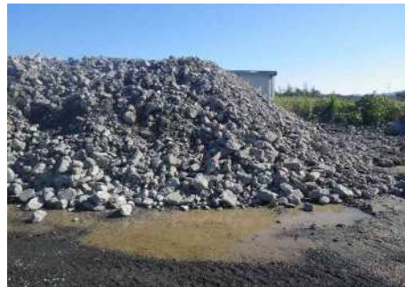
コンクリート塊ストック状況