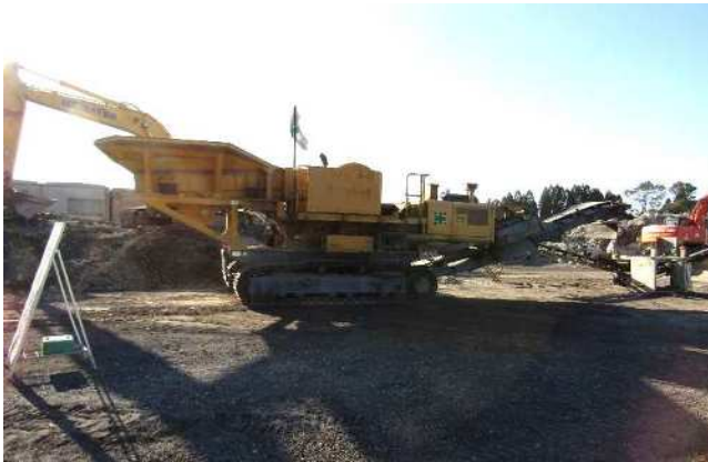
バックホウによる ガラパ Gos 投入状況