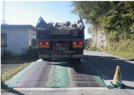
AS塊及びコン塊 処分受入