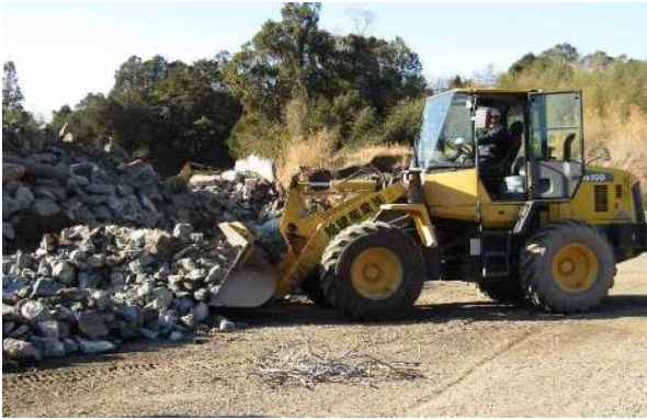
ホイールローダーによる コンクリートと アスファルトの混合 Co : As = 9 : 1