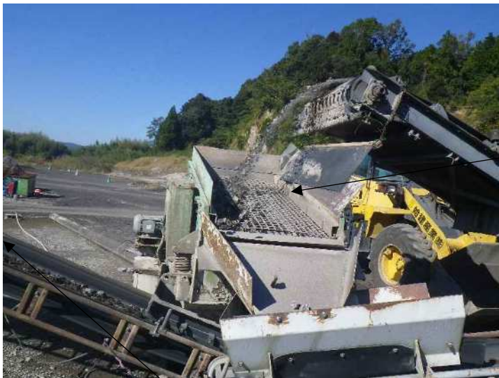
試料ふるいによる分別