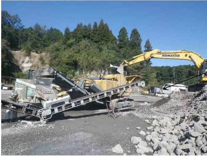
オーバーサイズは再度破碎