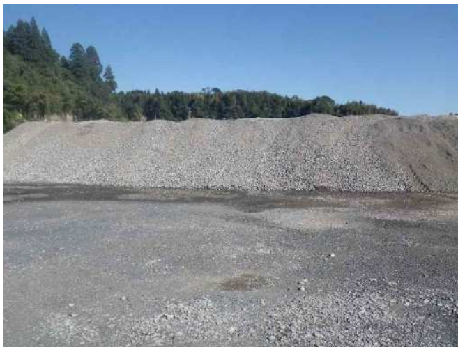
製品ストック状況