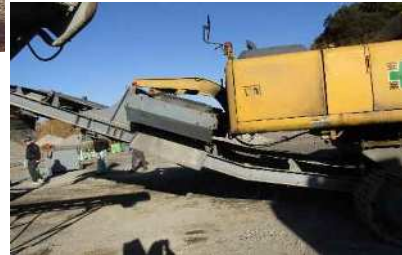
ガラパ Gos に装着されている磁選機 で鉄筋等の除去