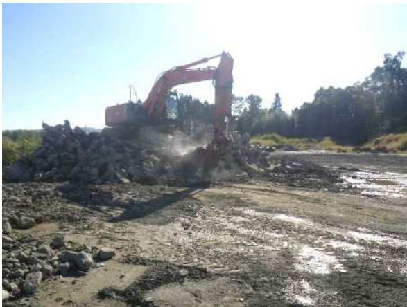
油圧ショベル・小割機による コンクリート塊を小割 マグネットで鉄筋等の除去