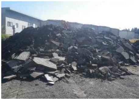
アスファルト塊ストック状況