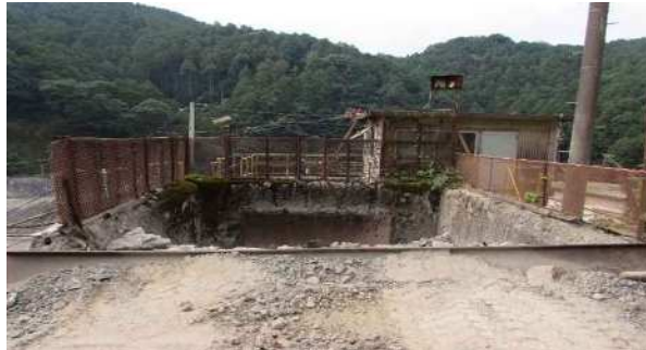
破碎プラントへの 投入口