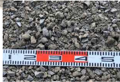
再生クラッシャーランRC-30