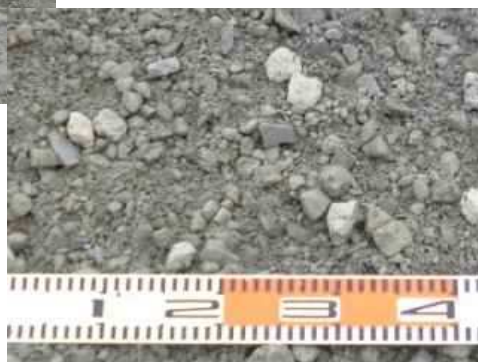
再生クラッシャーランRC-30