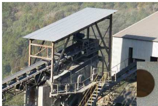
選別機 振動ふるい機