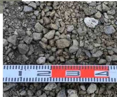
再生クラッシャーランRC-40