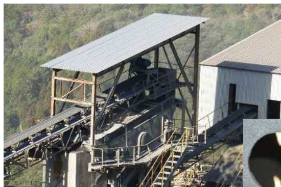
選別機 振動ふるい機