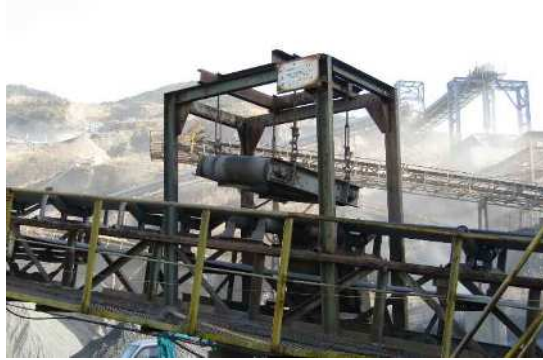
マグネットで 金属類の除去