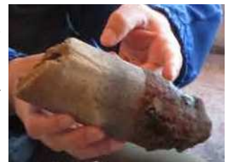
鉄の付いたフイゴの先端

こういった郷士が作った水車は製鉄以外にも利用して馬や牛などの骨から骨粉と呼ばれる肥料を作ったり、精米にも水車を利用していました。その名残は知覧金山水車や厚地松山製鉄遺跡に残っています。