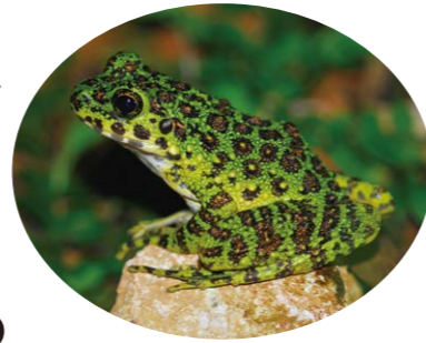
県指定天然記念物 アマミシカワガエル (絶滅危惧I) 【種の保存法指定種】

環境の悪化や心ない人たちの 盗掘・盗採 などによって、 絶滅の危機 に瀕している 生き物たちがいます!