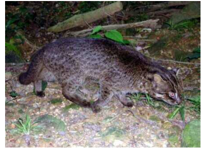
イリオモテヤマネコ