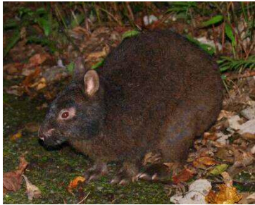
アマミノクロウサギ

推薦地は、イリオモテヤマネコ、アマミノクロウサギ、ヤンバルクイナなど、IUCN のレッドリストの絶滅危惧種 95 種（そのうち 75 種は固有種）を含む陸生動植物の生息・生育地である。また、その地史を反映し遺存固有種と新固有種の多様な事例がみられ、世界的にみても生物多様性の生息域内保全にとって極めて重要な自然の生息・生育地を包含した地域となっている。