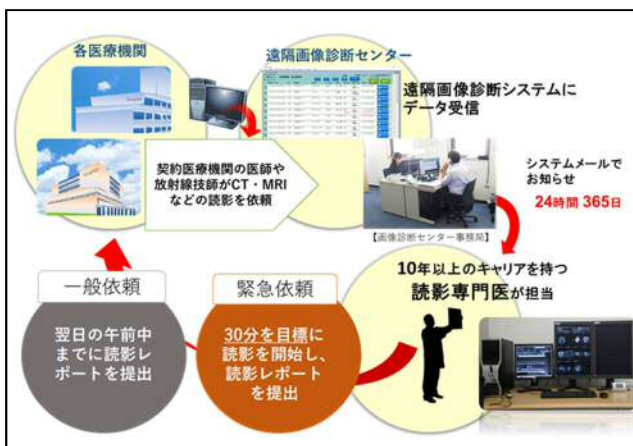
図 1. 遠隔画像診断のながれ

臨床情報をはじめ、所見・診断結果を詳細に記入し、併せて診断に重要な画像の貼り付けなどを行っている。気になる所見等については電話で説明するケースもある。