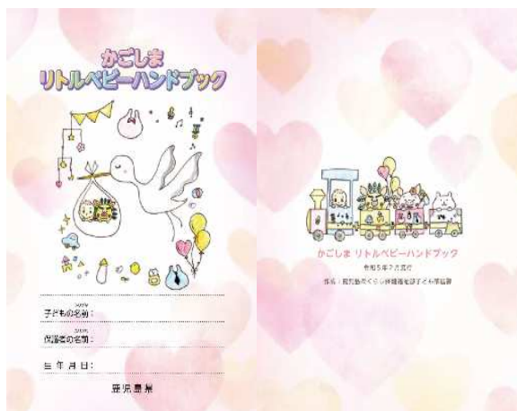
〈ハンドブック(表紙・裏表紙)〉

内容としては、先輩ママやパパ達からのメッセージや小さく生まれたお子さん向けの発育曲線（QRコードでの確認）、母子健康手帳には書く場所がない医療情報の書き込み欄、また、小さく生まれた赤ちゃんに関して知ってほしいことが盛り込んであります。