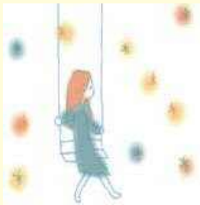
イラスト提供：ふわふわ。り

お電話でのご相談をご希望の際は、 リーフレットに掲載している各相談窓口へ、ご相談ください。