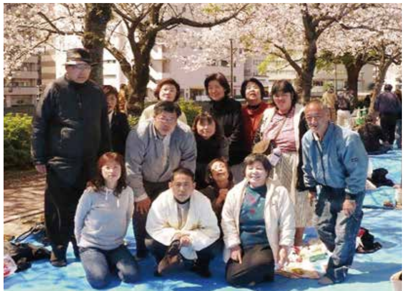
毎年恒例のお花見会にて

間を過ごしています。オープンは毎週木曜日と土曜日、加えて第1・3火曜日。火曜日と土曜日は13時〜15時半まで。ランチが食べられる木曜日は、10時から15時半まで開放しています。