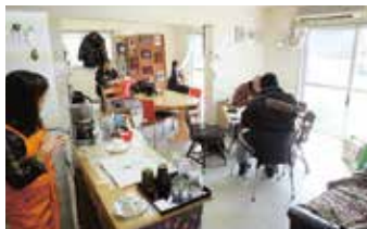
「いこいの部屋あらた」