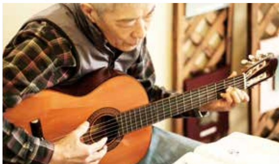
ギターに合わせて歌ったり、絵を描いたり自由に過ごす