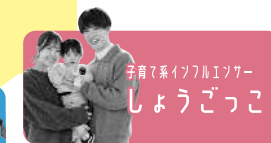
子育て系インフルエンサー しょうごっこ