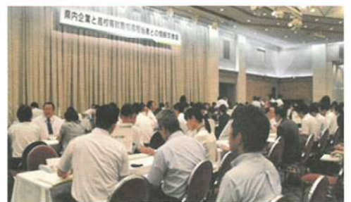
企業担当者と意見交換を行う教職員

鹿兒島労働局の発表によると、今年3月に卒業した県内高校生の就職内定率は99.4%。県内就職率は51.9%でした。