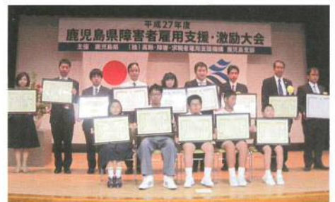
（障害者雇用支援・激励大会）