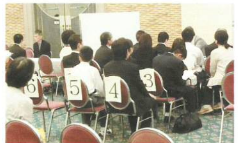
（障害者就職面接会）