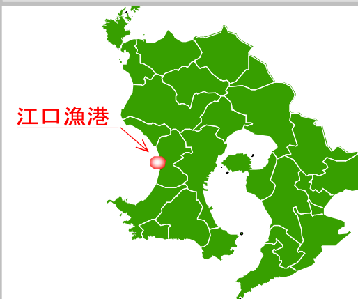
凡例 (事業実施年度)