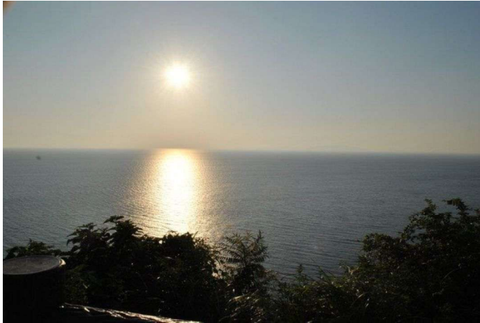
串木野サンセットパーク