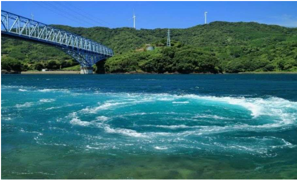
黒之瀬戸うずしお展望所 日本最大急潮のひとつ黒の瀬戸海峡 所在地 阿久根市脇本

阿久根 🌊 170種類の多様な魚種が獲れる！ 島津氏の統治下で、貿易と漁業で栄えた町！ 長島町はブリの養殖生産量日本一！ ウニや伊勢海老など旬の海の幸グルメイベントも魅力！