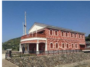
薩摩藩英国留学生記念館

19名の若き薩摩藩士が密かに英国へと旅立った地。留学までのいきさつや旅路、功績について、貴重な資料やミニシアターで紹介しており見応えがあります。