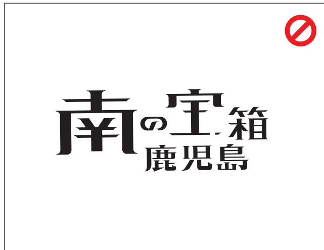
ロゴマークの一部が欠けた状態