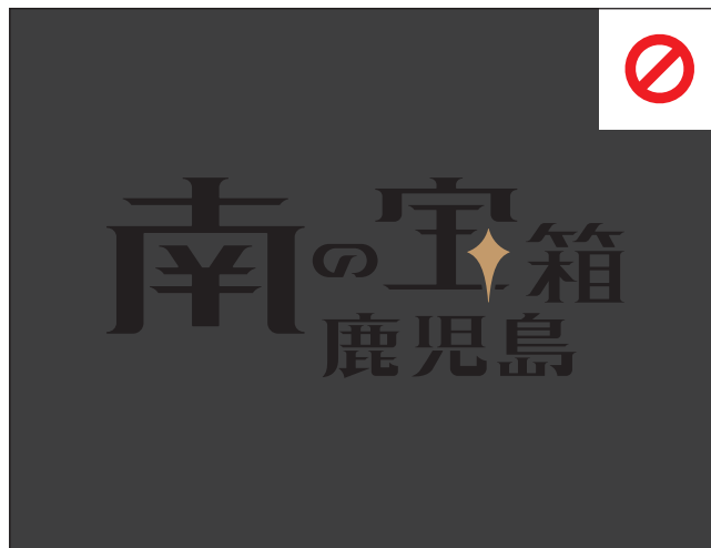
識別を損なう表示①