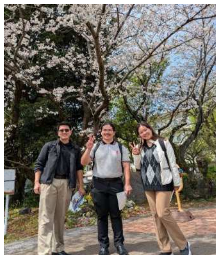
▲鹿児島大学での皆さん