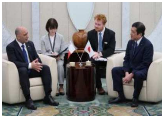
アンドレ・スピテリ駐日マルタ共和国大使 表敬訪問の様子