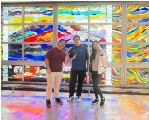
▲空港に到着した皆さん

この文化的、技術的な交流の価値は、これから生み出されるプロジェクトのなかに現れるはずです。日本の「細部へのこだわり」の本質を学び、帰国した際には、より成熟し、グローバルで、コンセプトの明確なビジョンを自らのデザイン実践に反映させたいと考えています。デジタルテクノロジーと日本の美意識が美しい調和を持って共存する新たな視点を、周囲の人々と共有できる日を楽しみにしています。