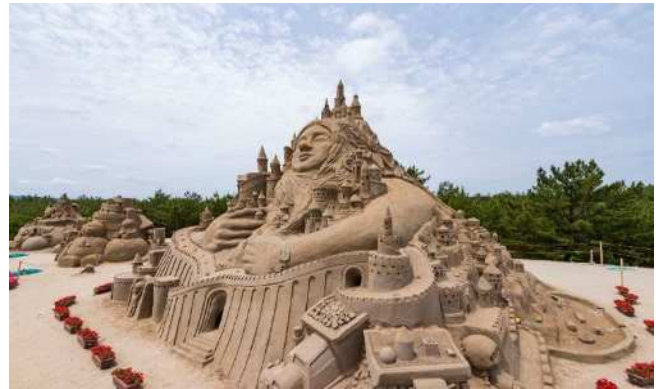
▲砂の祭典の様子

「日本三大砂丘」のひとつ、吹上浜の貴重な砂を活用したイベントで、人と自然が調和する素晴らしい空間を提供します。市民総ぐるみの運営で、誰もが楽しめるイベントです。