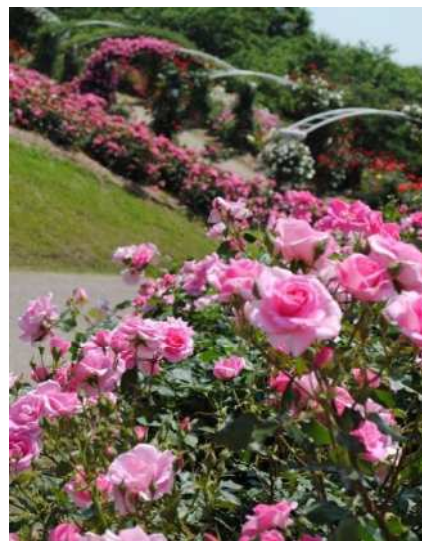
かのやばら園「◎ K. P. V. B」▶

キッチンカーフェスやふれあい動物園、おおすみハナマルシェなどのイベントが開催されるほか、週末ごとに開催される講座やグッズ販売、ガーデンツアーなど催し物が盛りだくさん。春のバラは、一斉に咲き誇り華やかでボリューム感があり、つるばらアーチは、見るものを魅了するほどの美しさです。