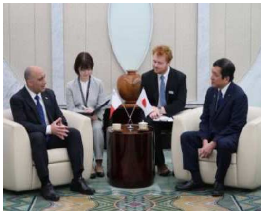
▲马耳他驻日大使安德烈·斯皮特利进行礼节性拜访的情景