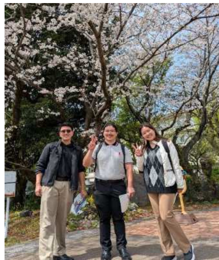
▲在鹿儿岛大学的合照