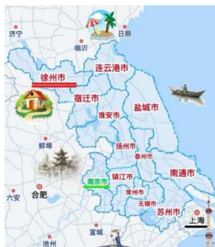
江苏省徐州市的地理位置

因为喜欢宫崎骏老师的动漫，对日语产生了浓厚的兴趣，所以本科我选择了日语作为我的专业。研究生时期因为想多挑战一些新鲜事务，所以转而选择攻读法律专业，并在研究生毕业后在日企作为法务工作了两年时间。