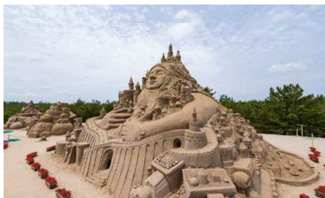
▲沙雕节的情景

这是一场活用“日本三大沙丘”之一——吹上滨珍贵沙丘资源的活动，旨在营造人与自然和谐共处的绝佳空间。活动由全体市民共同参与运营，是一场人人都能乐在其中的盛会。