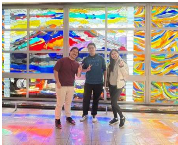
▲在鹿儿岛机场的合照

这种文化与技术交流的价值，必将在未来诞生的项目中得以体现。我希望通过学习日本“对细节的执着”这一精髓，在回国后，将更加成熟、具有全球视野且理念清晰的愿景融入自己的设计实践中。我期待着能与周围的人分享这一全新视角——即数字技术与日本美学意识在和谐共存中交相辉映。