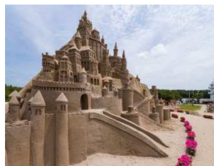
▲沙雕节的情景

2026年的主题是“沙之漫步 ~用沙筑造的城堡故事~”。从载入史册的名城，到故事中出现的梦幻城堡，无数城堡在沙的世界里巍然耸立。您可以一边在“街区”中“漫步”，一边享受由沙子营造出的非日常氛围。