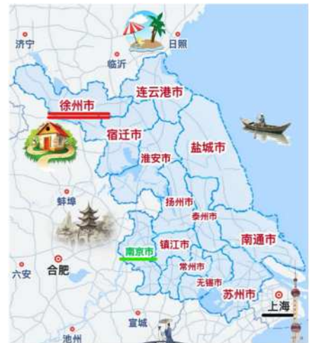
장쑤성 쉬저우시의 위치

저는 중국 장쑤성 최북단에 있는 쉬저우시에서 태어났습니다. 쉬저우는 『삼국지』의 인물 「초왕」항우의 고향이며 교통의 요지로 오래전부터 병가 필쟁의 땅으로 알려져 있습니다. 미야자키 하야오의 애니메이션을 좋아해 일본어에 관심이 많았고, 대학에서 일본어를 전공했습니다. 대학원에서는 새로운 것에 도전하고 싶어 법학을 전공하고 졸업 후에는 일본계기업에서 2년동안 법무 업무를 하였습니다.