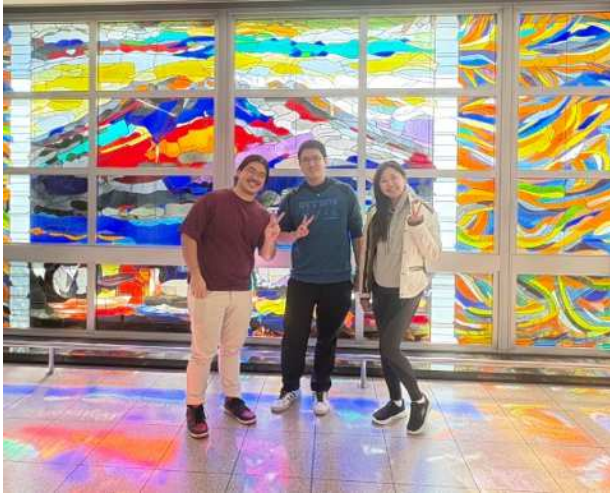
▲공항에 도착한 유학생들