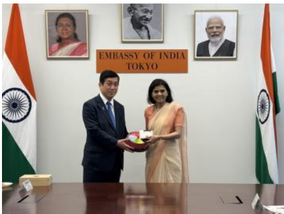
▲知事与大使纳格玛·穆罕默德·马利克合照

盐田知事表示，感谢迄今为止与本县的交流，并表示希望今后双方继续通力合作，共同维护和发展这一关系。