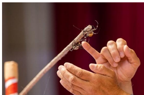
▲斗蜘蛛大会现场