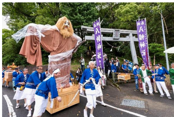
▲插秧节的照片