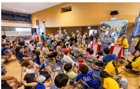
▲斗蜘蛛大会现场

活动当天，从小学生到成年人，共有约120人参加。参与者热情高涨，这是一项至今仍深受当地民众喜爱并代代相传、在全国范围内也极为罕见的传统活动。