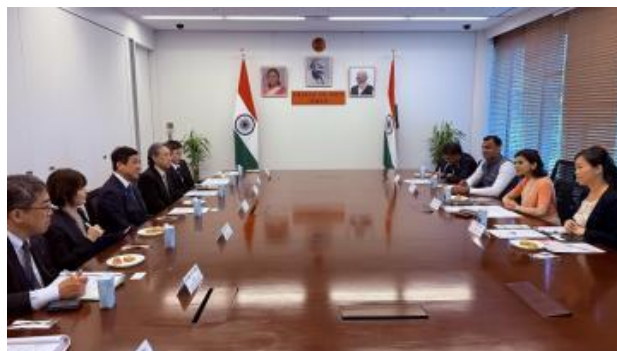
▲知事与大使纳格玛·穆罕默德·马利克交换意见