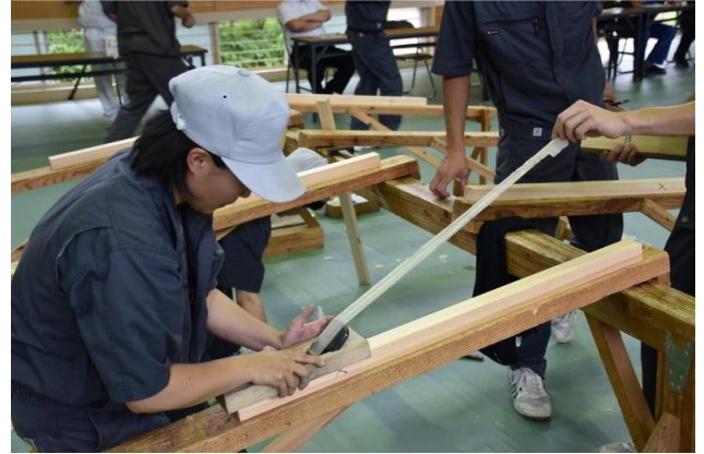
開校記念行事（かな薄削り大会）