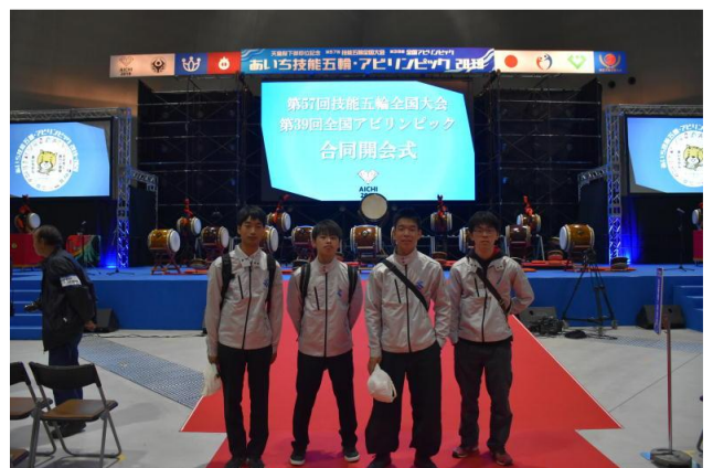
技能五輪全国大会