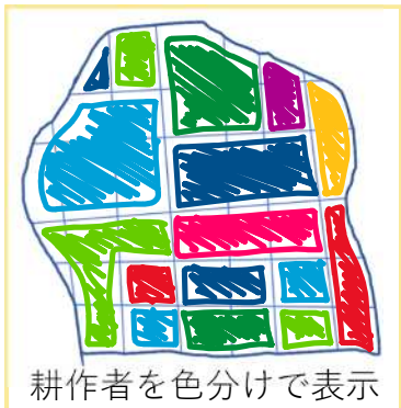
耕作者を色分けで表示