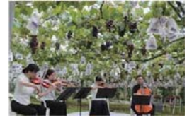
クラシックブドウ浜田農園