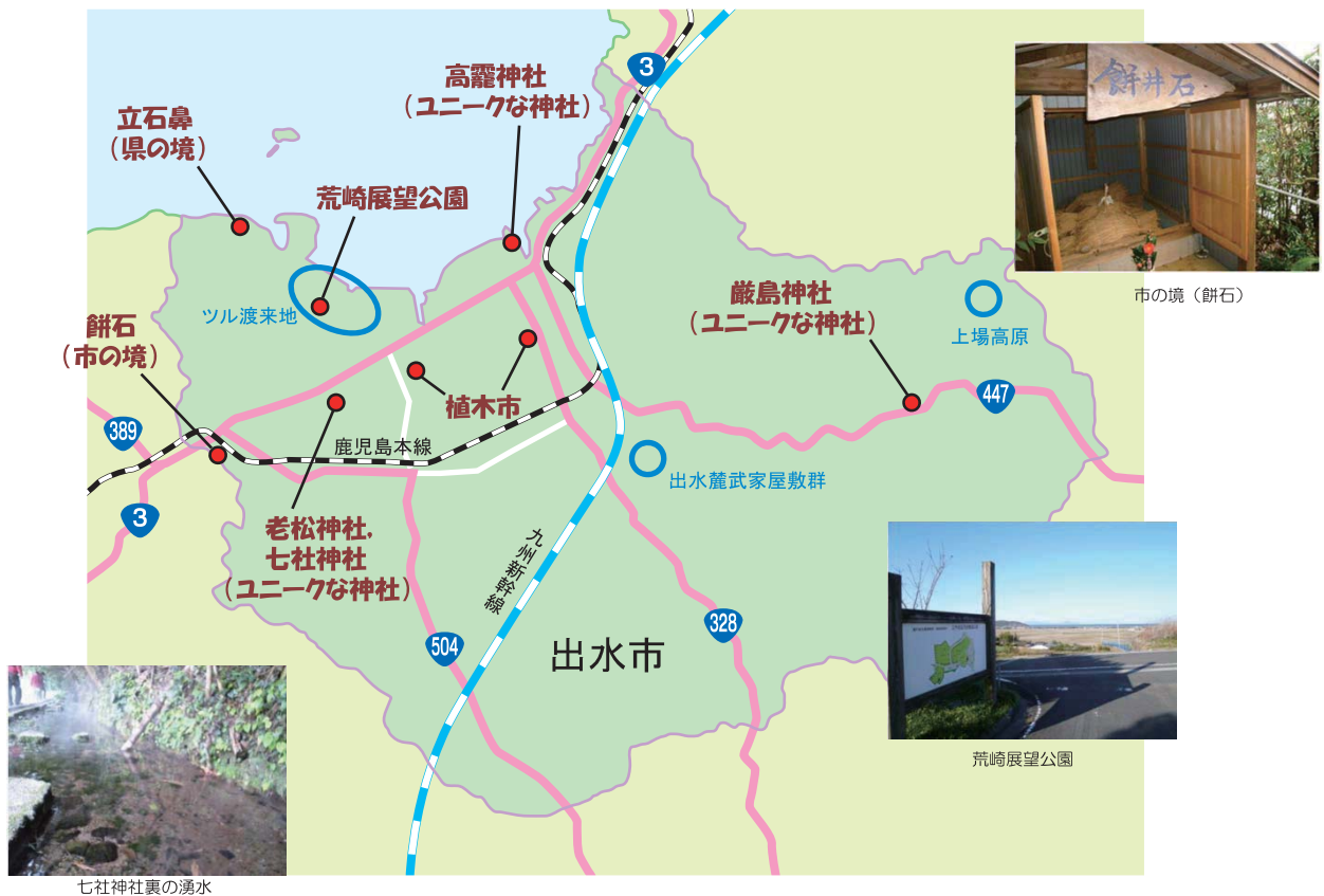
七社神社裏の湧水