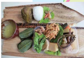
竹皮弁当(うんめもんの会)