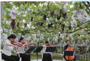
クラシックブドウ浜田農園