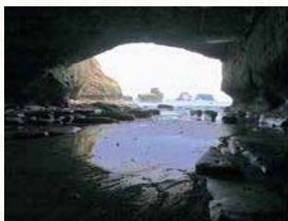
千座(ちくら)の岩屋