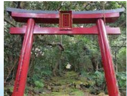
⑦ 黒島の神社(黒尾神社)