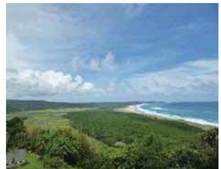
③ 大パノラマが広がる七色観望台