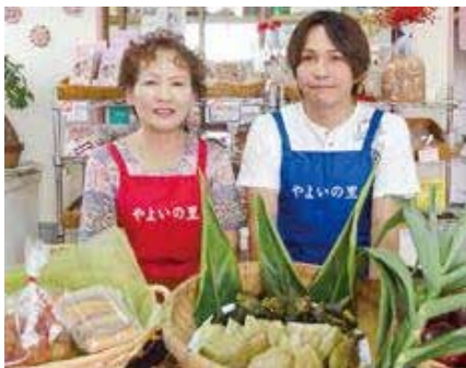
①② 南種子の食べ物が揃う