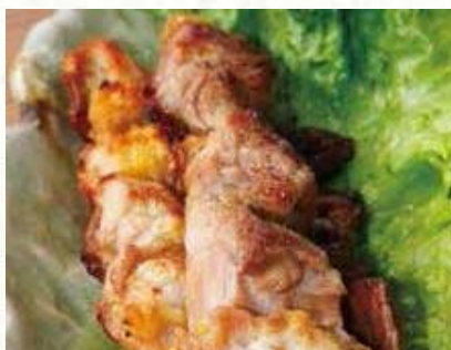
インギー地鶏の焼き鳥

どんな人たちをも迎え入れてくれるこの島には、美しい景色と本物の美味しさがあります。