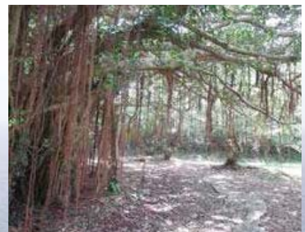
③ 七色観望台へ続くガジュマルトンネル