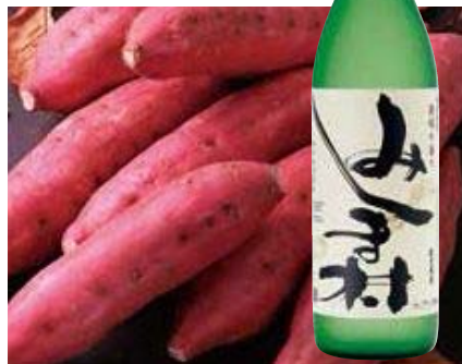
② 焼酎 みしま村