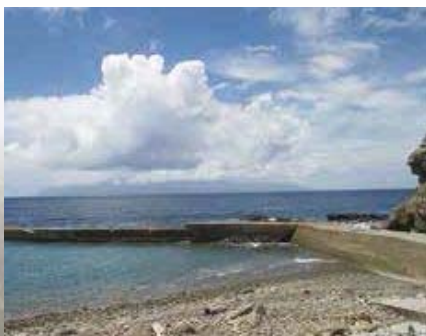
④ 南種子から屋久島を眺めよう