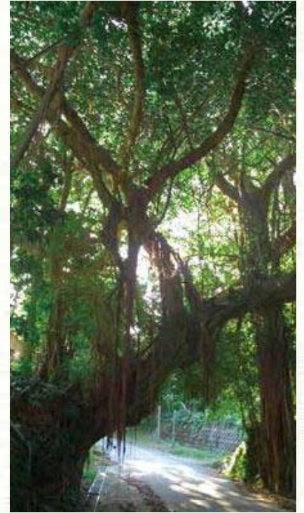
竹島：ガジュマルの門