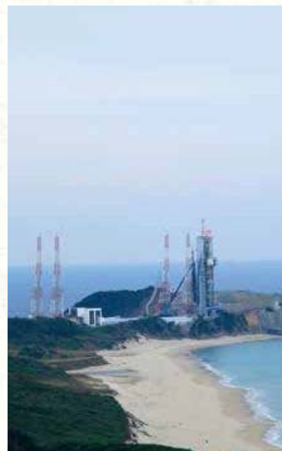
種子島宇宙センター