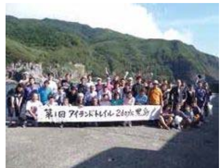
③ アイランドトレイル 2days 黒島