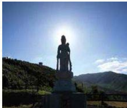
黒島：平和公園の観音像