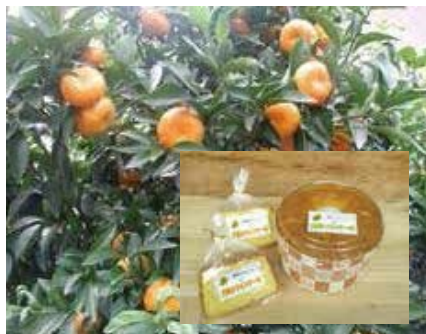
① 黒島みかん、大里シフォンケーキ