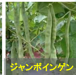
ジャンボインゲン