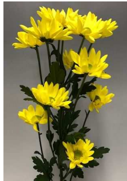
「モゼゴールド」の花容・草姿