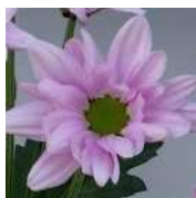
花の拡大 立弁で緑心が美しい