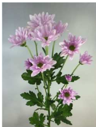
サザンサマーピンクの花容・草姿