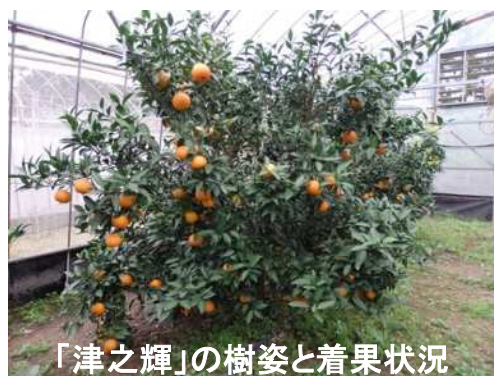
「津之輝」の樹姿と着果状況