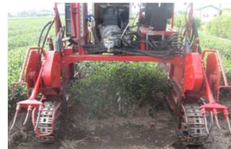
乗用型土壌反転機