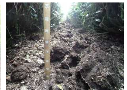
反転・混和後の茶園うね間土壌