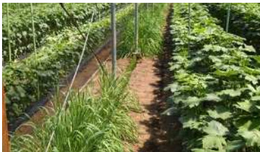
エンバク等のバンカー植物