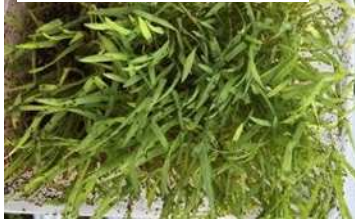
代替餌のアブラムシ