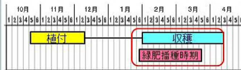
奄美地域におけるジャガイモ作型と緑肥播種時期