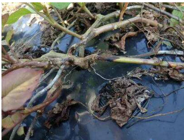
図2 株元の腐敗状況