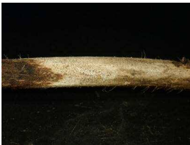
図4 つる褐色病斑上の分生子殻