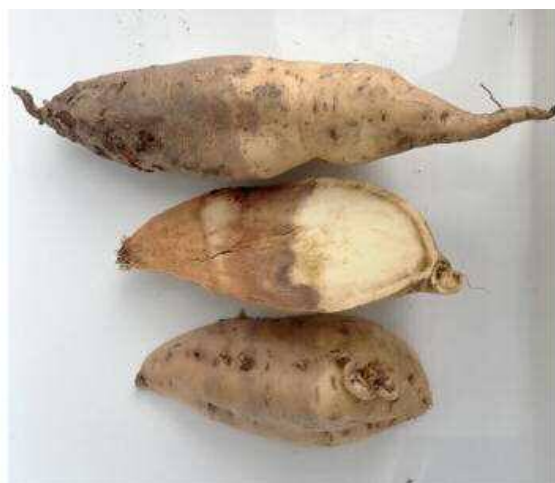
図3 被害いも塊根の腐敗状況