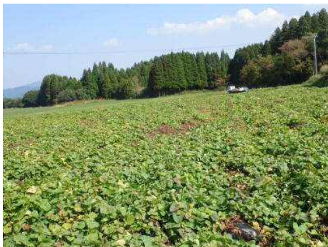
図1 圃場の発生状況

イ 岸 国平編 (1998) 日本植物病害大事典. pp.103-104. 全国農村教育協会.