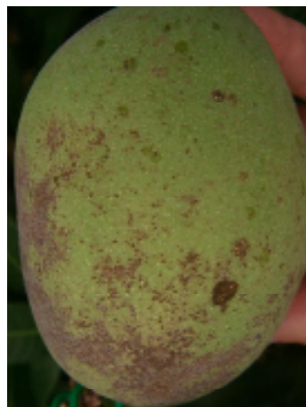
写真2 被害果実（マンゴー）