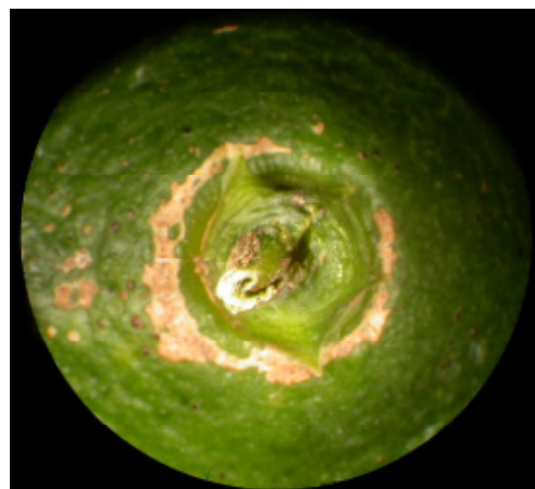
写真4 被害果実（ミカン）