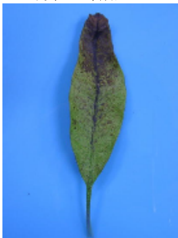
写真3 被害葉（マンゴー）