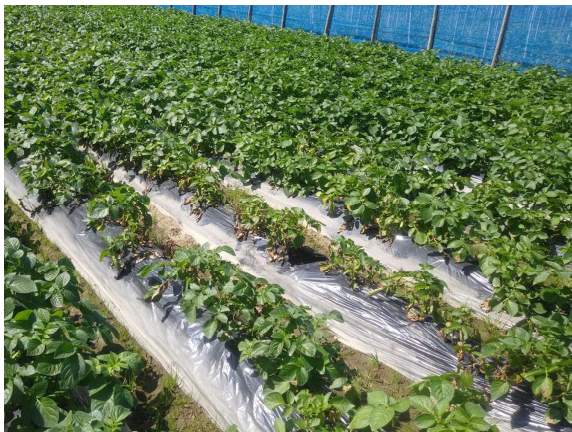
図1 南大隅町での発生ほ場（令和5年3月2日）