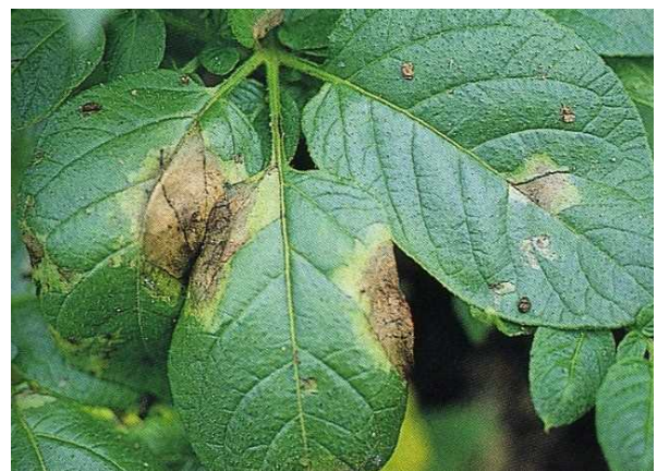
図2 バレイショでの疫病の病徴