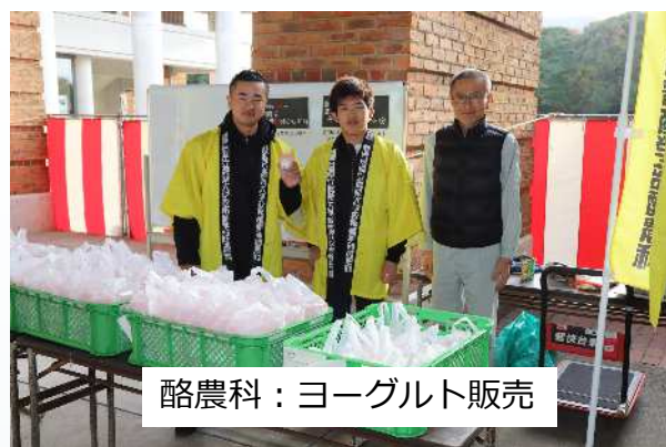
酪農科：ヨーグルト販売