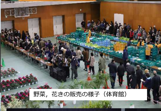
野菜、花きの販売の様子（体育館）