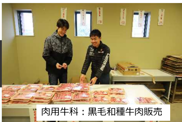
肉用牛科：黒毛和種牛肉販売