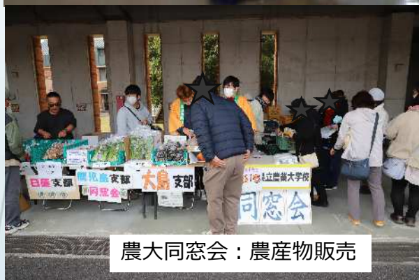
農大同窓会：農産物販売