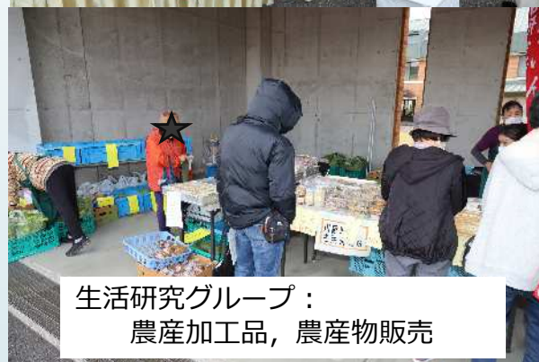
生活研究グループ： 農産加工品、農産物販売