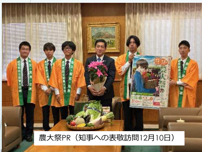
農大祭PR（知事への表敬訪問12月10日）