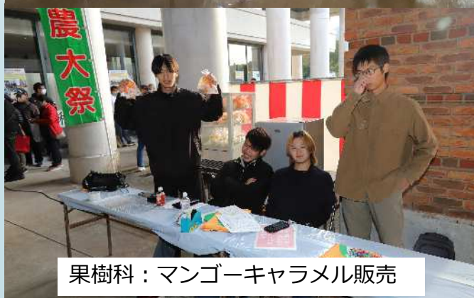
果樹科：マンゴーキャラメル販売