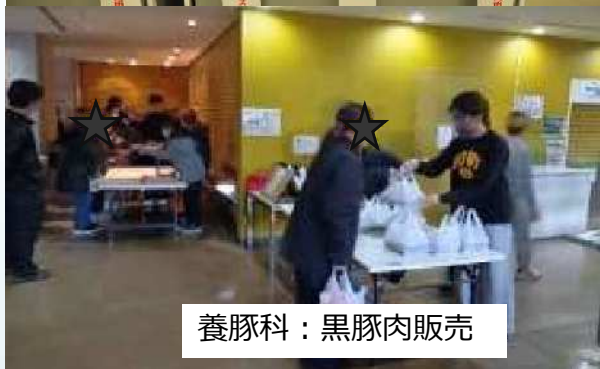
養豚科：黒豚肉販売