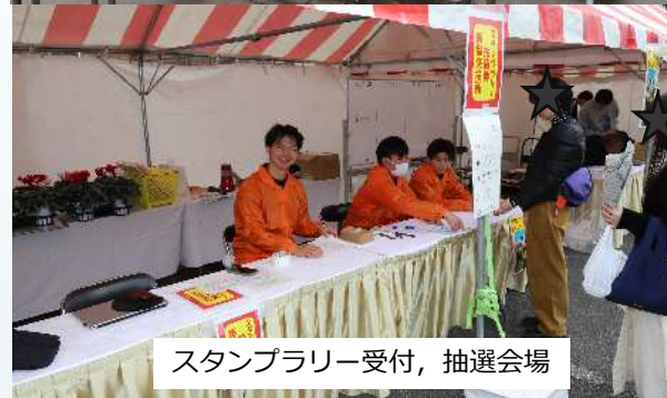
スタンプラリー受付、抽選会場