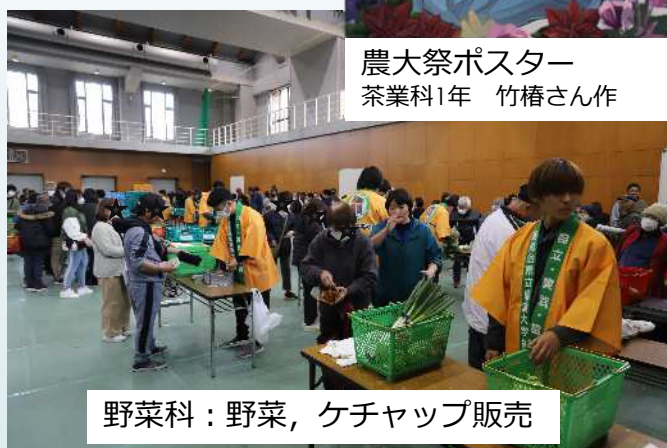
野菜科：野菜、ケチャップ販売