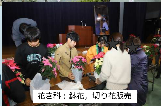
花き科：鉢花、切り花販売