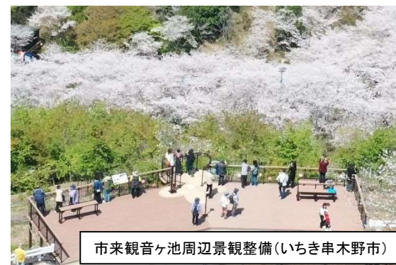
市来観音ヶ池周辺景観整備(いちき串木野市)