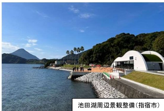
池田湖周辺景観整備(指宿市)