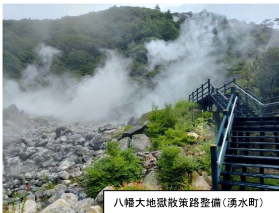
八幡大地獄散策路整備(湧水町)