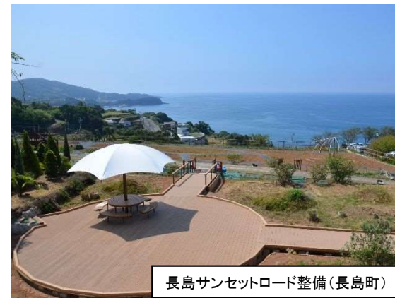
長島サンセットロード整備(長島町)