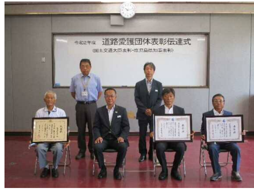
受賞者左から古田長生会（大臣表彰）、大木建設ボランティア愛好会（知事表彰）、仲林建設ボランティア愛好会（知事表彰）