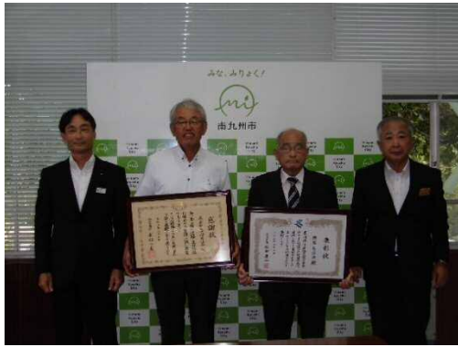
受賞者左：本別府大久保自治会（大臣表彰） 受賞者右：横峯自治会（知事表彰）