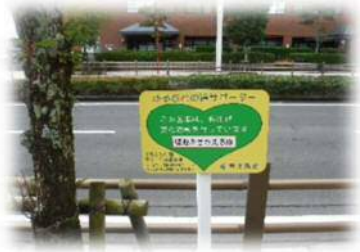
<サインボード設置写真>