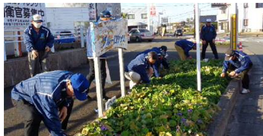
(シニアソフトボールクラブ種子島ブルーロケッツ)

昨年、道路愛護関係では、 シニアソフトボールクラブ 種子島ブルーロケッツ（中種子町） が受賞しました。