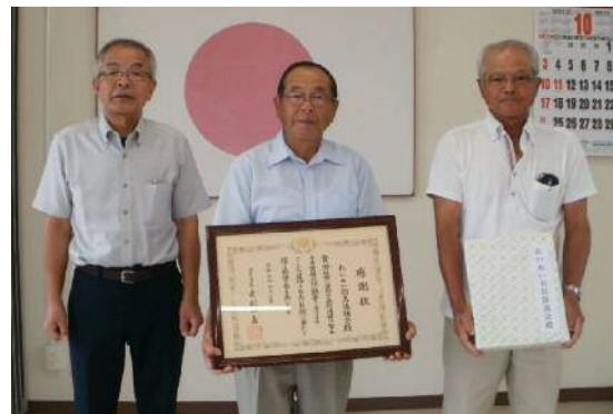
(れいめい羽島協議会)