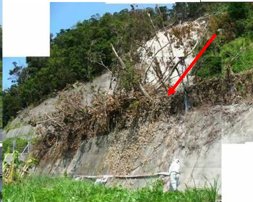
崩壊土砂捕捉状況