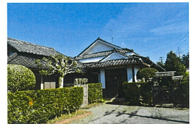
写真3：当該空き家の外観