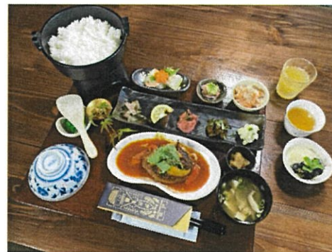
写真5：「伊佐米膳」の例