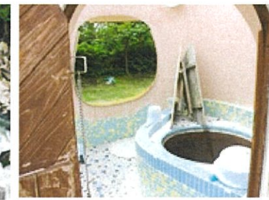
写真7：五右衛門風呂