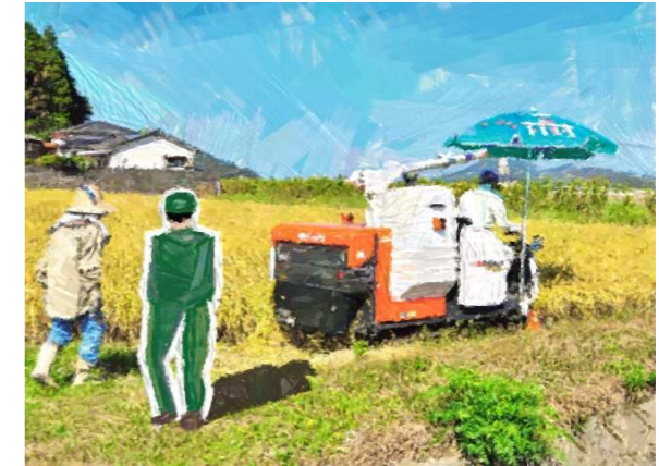
米作り実践時のイメージ