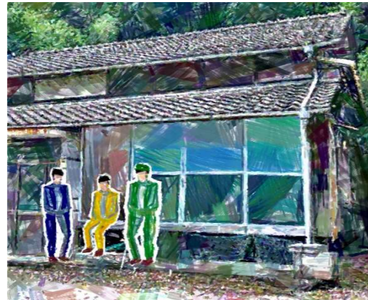
縁側利用時のイメージ