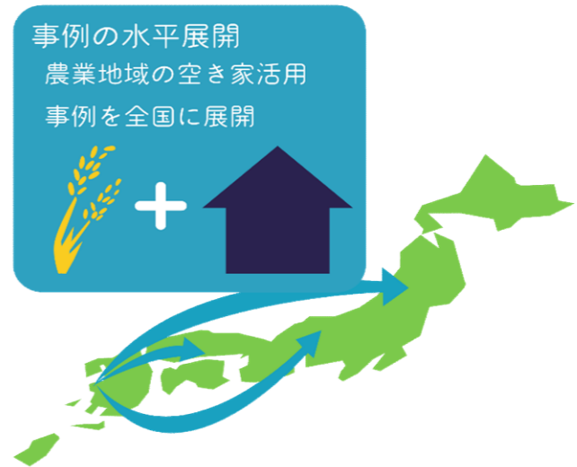
水平展開のイメージ