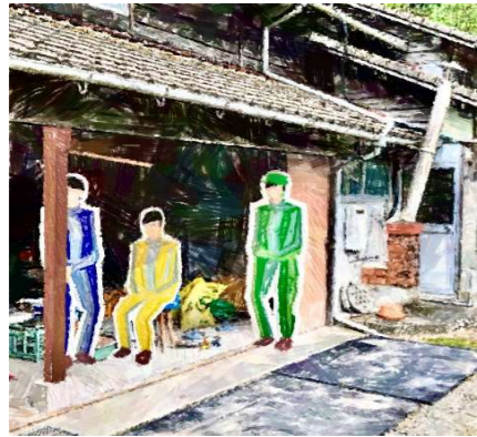
馬屋利用時のイメージ