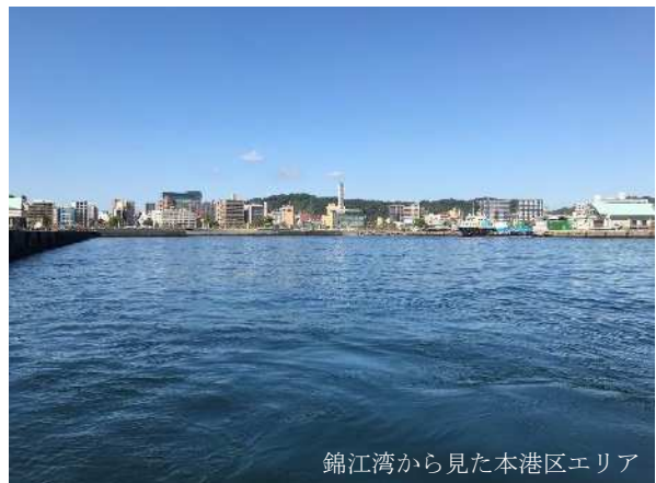
錦江湾から見た本港区エリア