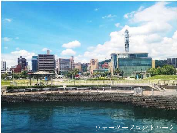
ウォーターフロントパーク