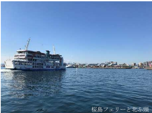
桜島フェリーと北ふ頭