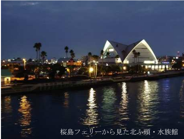
桜島フェリーから見た北ふ頭・水族館