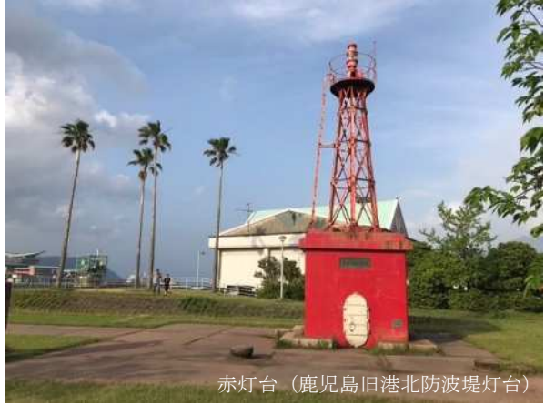
赤灯台 (鹿児島旧港北防波堤灯台)