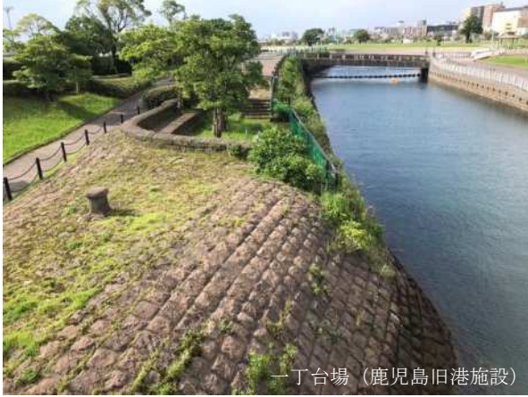
一丁台場 (鹿児島旧港施設)