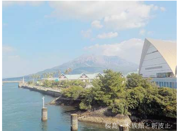
桜島・水族館と新波止