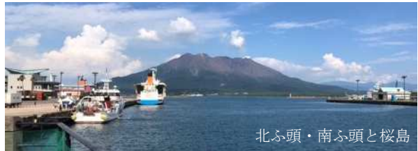
北ふ頭・南ふ頭と桜島