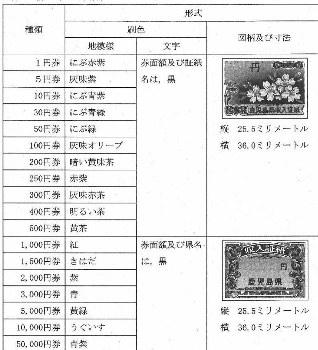
別表第2（第3条の2関係）