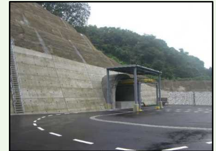
地中式火薬庫（イメージ）