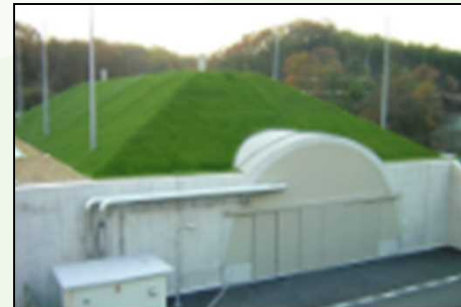
地上式火薬庫（イメージ）