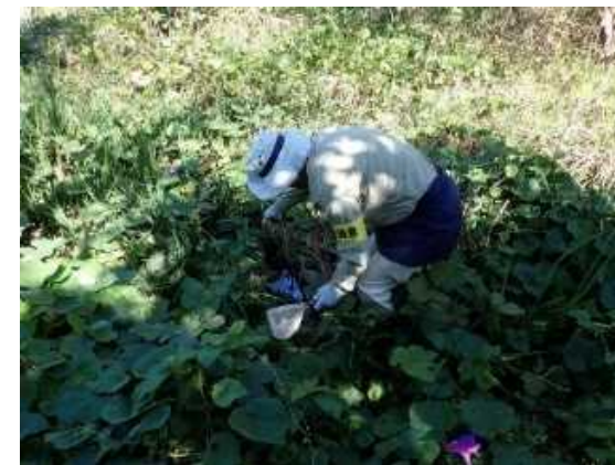
環境調査のイメージ