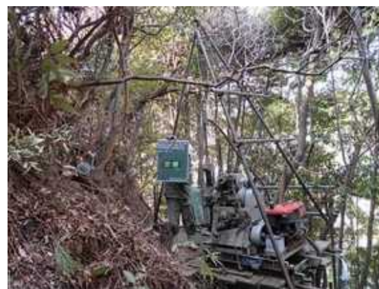
土質調査のイメージ