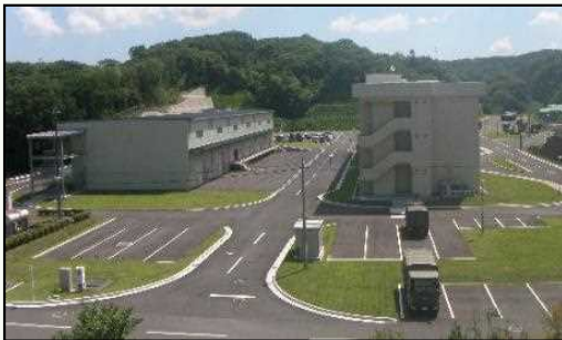
管理庁舎施設（イメージ）

※部隊の規模についても、適地調査を行う段階であり、現時点で決まっていない（火薬庫のある防衛施設の一例として沼田分屯地の定員は約60名）